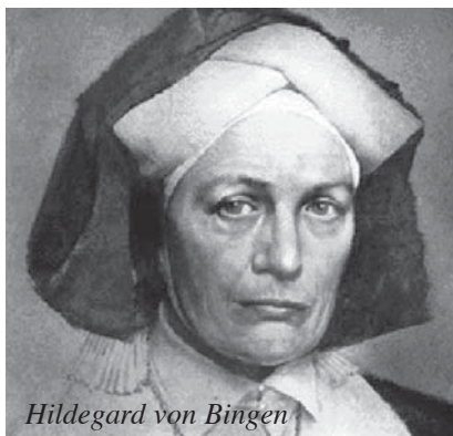
Hildegard von Bingen

Schon in Zeiten der Urahnen galt es als spezifisches Heilmittel bei Verletzungen durch Eisenverbindungen (Pfeile, Messer..) und wird so vor allem bei Infektionen der Wunden auch in homöopathischer Form neben "Ledum" und dem Auflegen von "Bockshornkleepulver", (=Semen foenum-graecum), welches ebenfalls schon die Druiden kannten, verwendet. Als Anwendung bei alten, störenden Wunden also eine keltische "Narbenentstörung"?